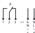
Programador semanal 92658 (1 canal)