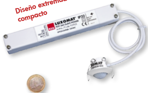
"Referencia de tamaño"