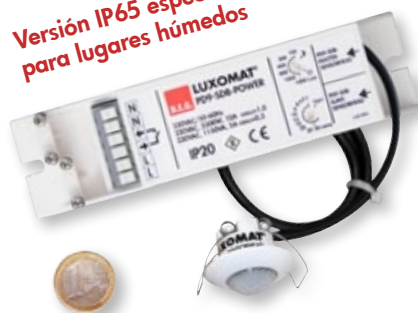
"Referencia de tamaño"

Versión IP65 especial para lugares húmedos