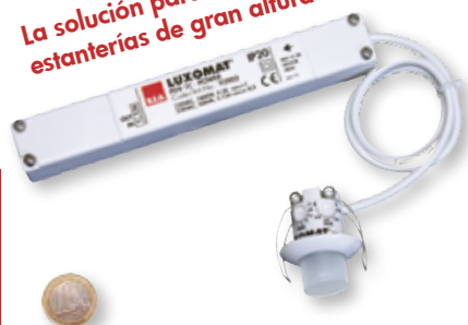
"Referencia de tamaño"

La solución para naves con estanterías de gran altura