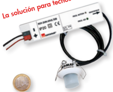
"Referencia de tamaño"