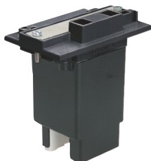
Grupo bobina completo