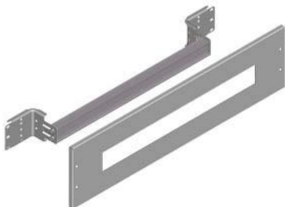
Figure à titre d'exemple

ALPHA 630 Universel, Kit de montage, appareillage d'installation modulaire, H=200mm, l=600mm, 24TE, Distance entre rangées 200mm, avec plastron de colonne