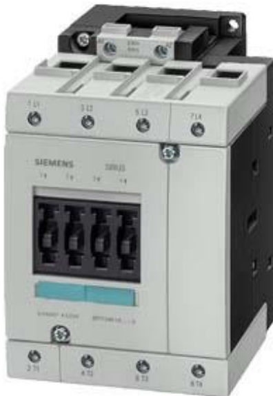
Figure à titre d'exemple

Contacteur, AC-1, 140 A, 42 V CC, 4 pôles, taille S3, borne à vis !!! Produit en fin de vie !! Le successeur est SIRIUS 3RT2