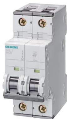
Automático magnetotérmico 400V 10kA, 2 polos, C, 0,3A, T=70 mm