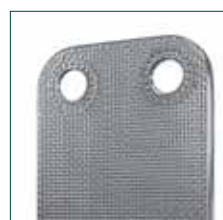
Design innovativo delle micropiastre