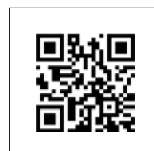
Effettuare la scansione del codice QR per ulteriori informazioni tecniche e per i codici articolo