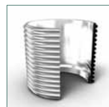
Collegamento flessibile "due in uno"