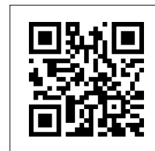
Für weitere technische Informationen und Bestellnummern scannen Sie bitte den QR-Code.