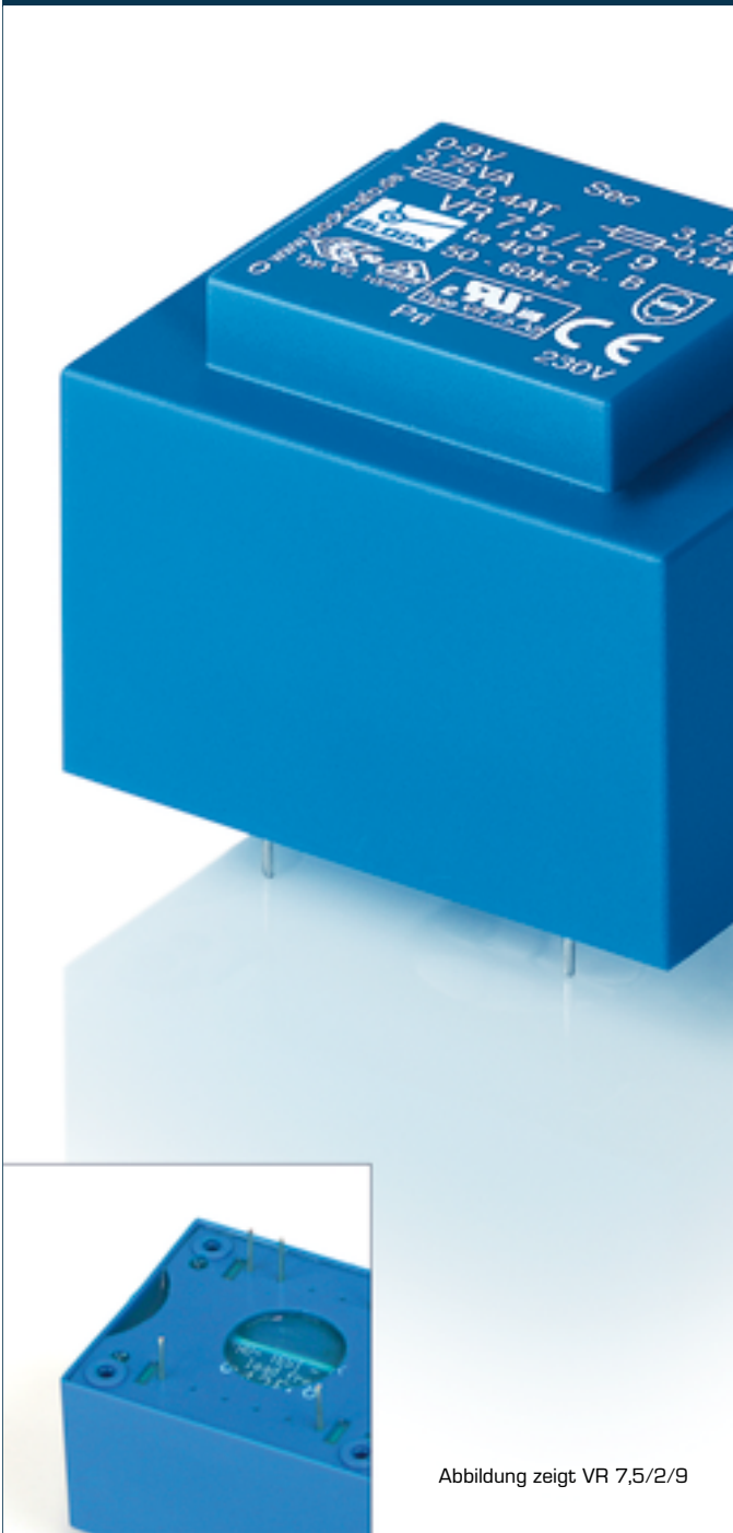
Abbildung zeigt VR 7,5/2/9