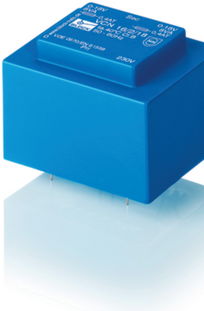
Abbildung zeigt VCN 16/2/18