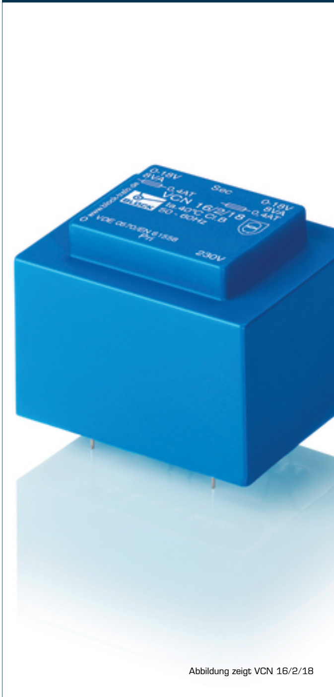
Abbildung zeigt VCN 16/2/18