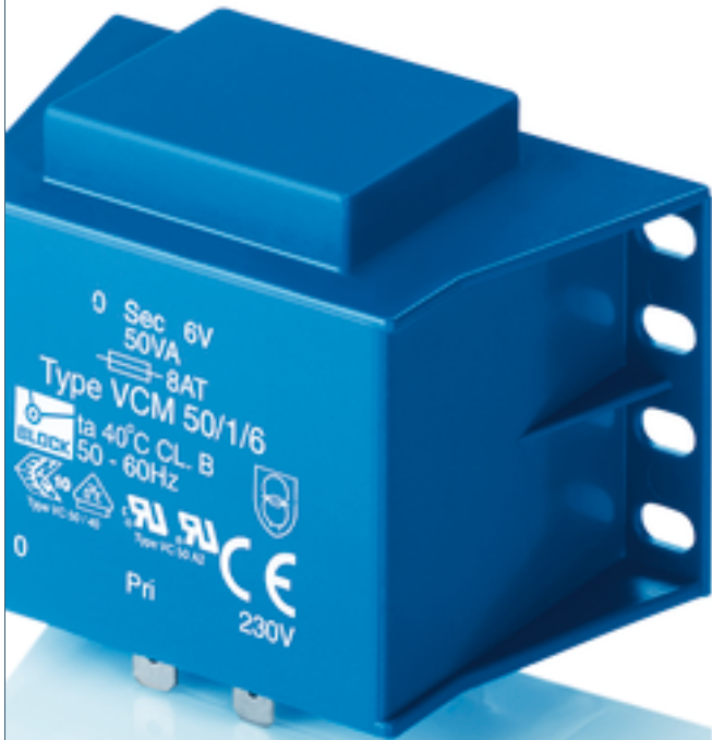
Abbildung zeigt VCM 50/1/6