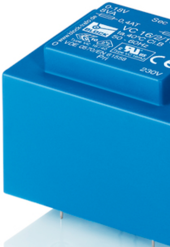
Abbildung zeigt VC 16/2/18