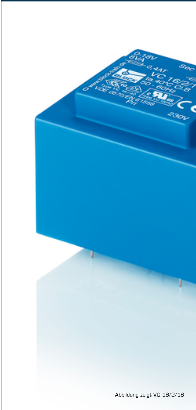
Abbildung zeigt VC 16/2/18