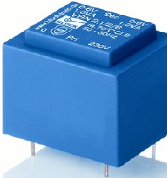
Abbildung zeigt VBN 2,1/2/6