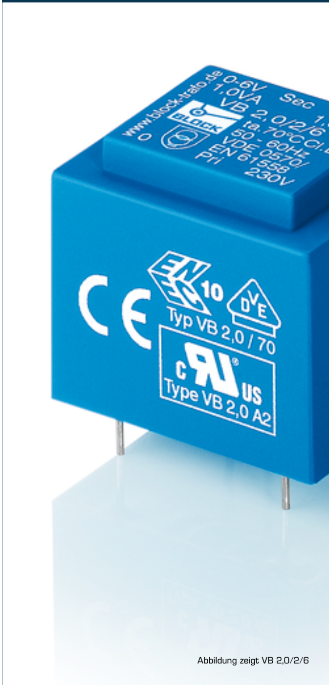
Abbildung zeigt VB 2,0/2/6