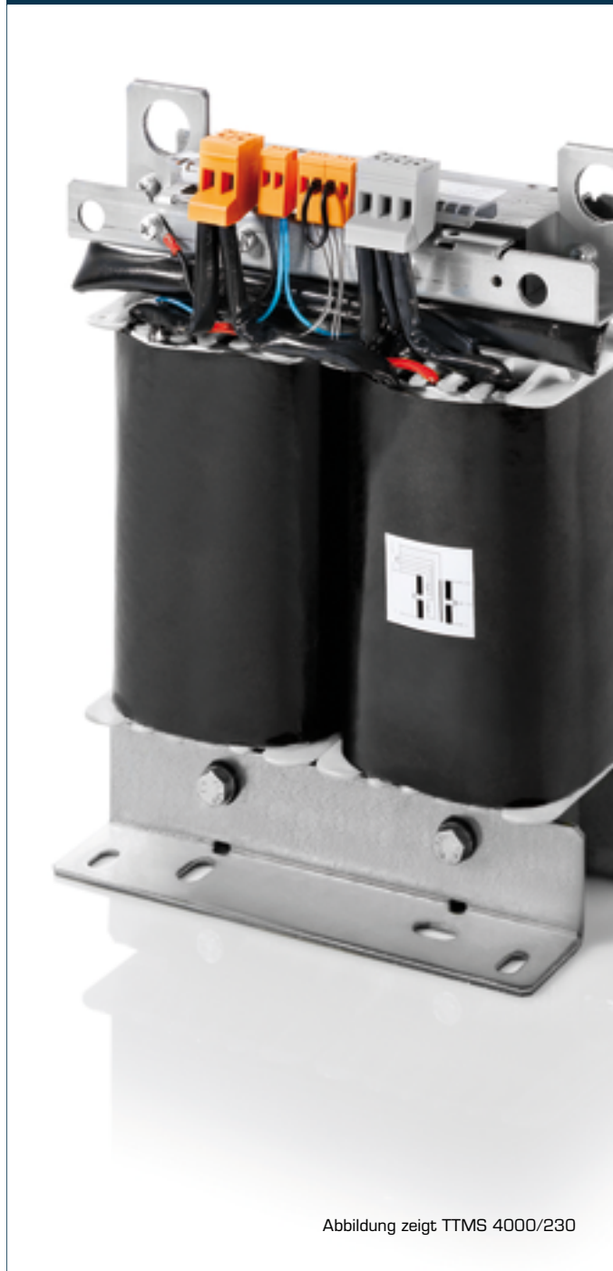
Abbildung zeigt TTMS 4000/230