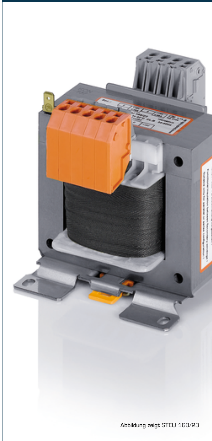
Abbildung zeigt STEU 160/23