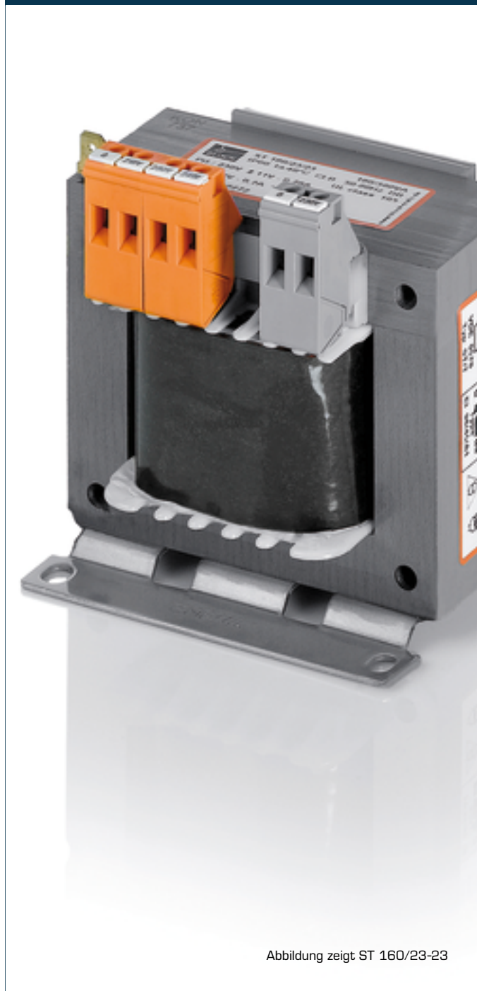
Abbildung zeigt ST 160/23-23