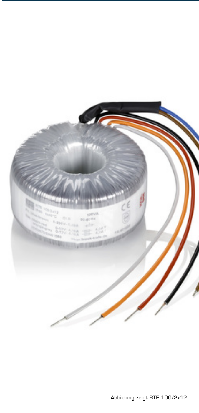
Abbildung zeigt RTE 100/2x12