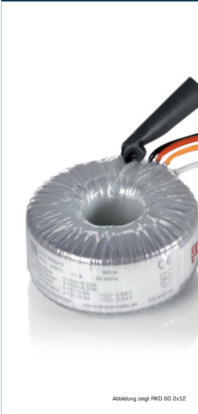
Abbildung zeigt RKD 60 2x12