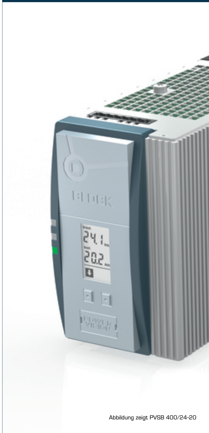
Abbildung zeigt PVSB 400/24-20