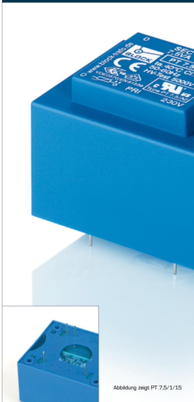
Abbildung zeigt PT 7,5/1/15