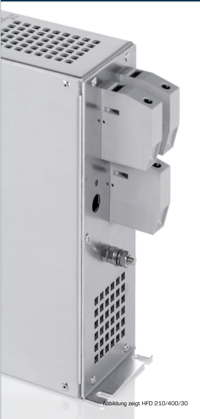
Abbildung zeigt HFD 210/400/30