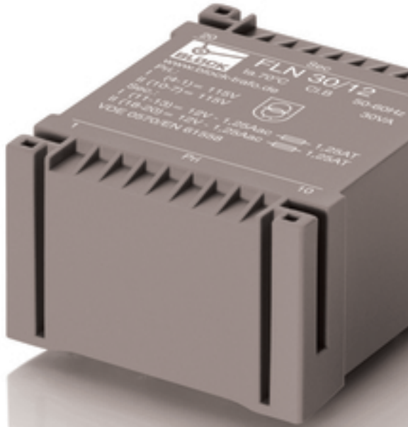
Abbildung zeigt FLN 30/12