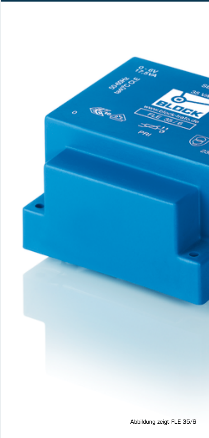
Abbildung zeigt FLE 35/6