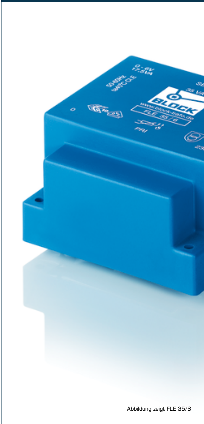
Abbildung zeigt FLE 35/6