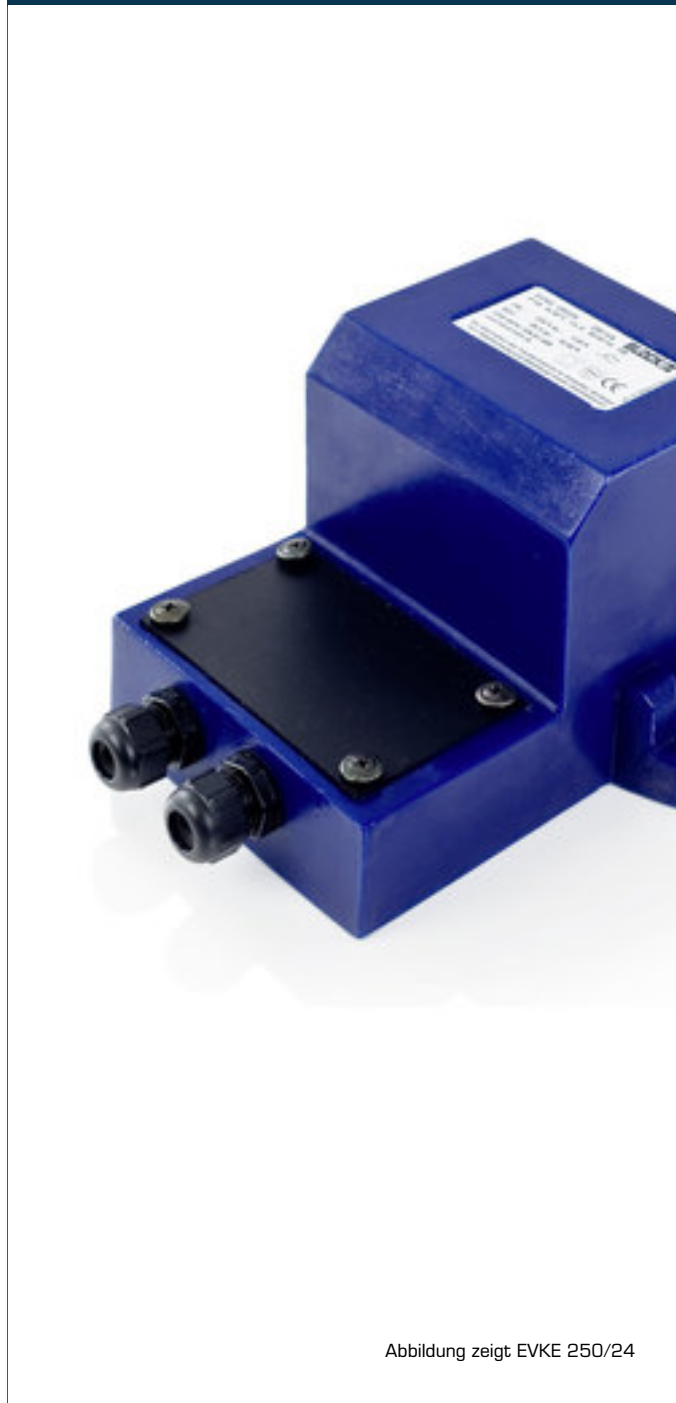
Abbildung zeigt EVKE 250/24