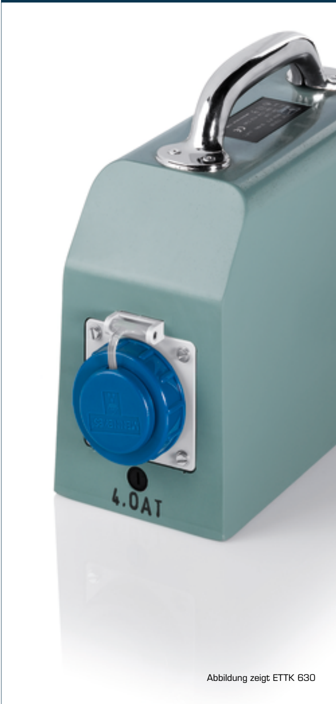
Abbildung zeigt ETTK 630