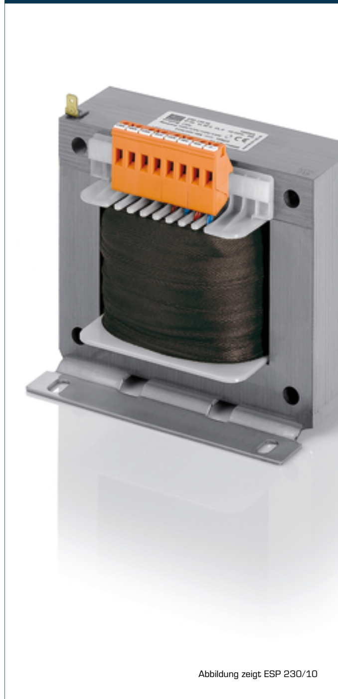
Abbildung zeigt ESP 230/10