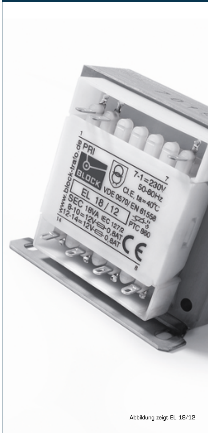
Abbildung zeigt EL 18/12