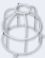
Panier de protection