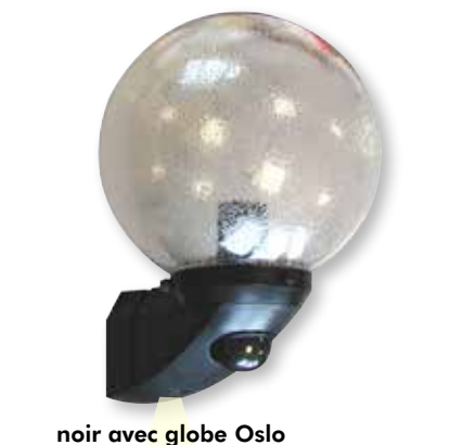
noir avec globe Oslo