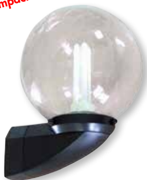
noir avec globe Oslo

Pour lampes fluo-compactes compactes 2G7