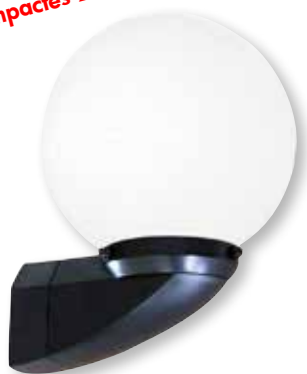
noir avec globe Vienne

Pour lampes fluo- rescentes compactes 2G7