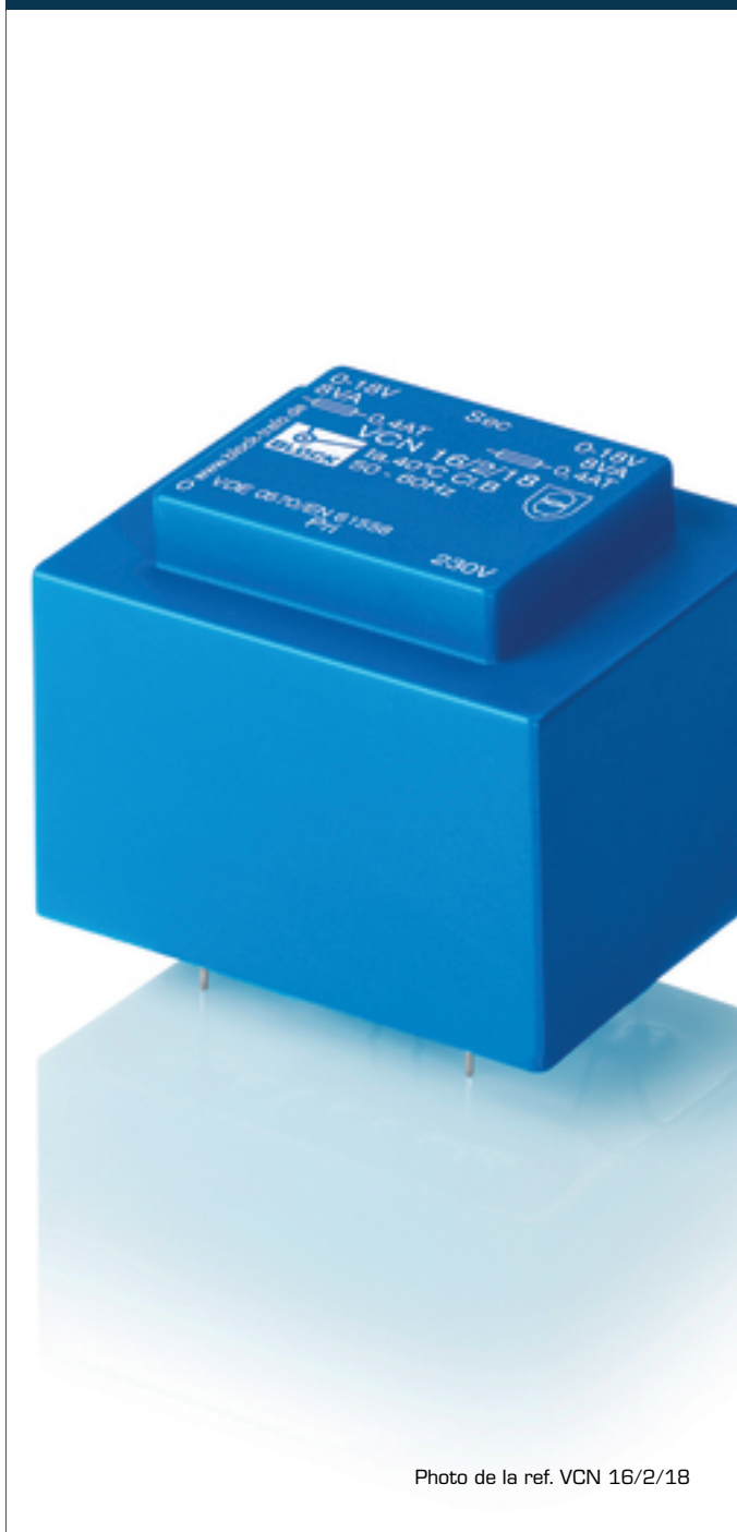
Photo de la ref. VCN 16/2/18