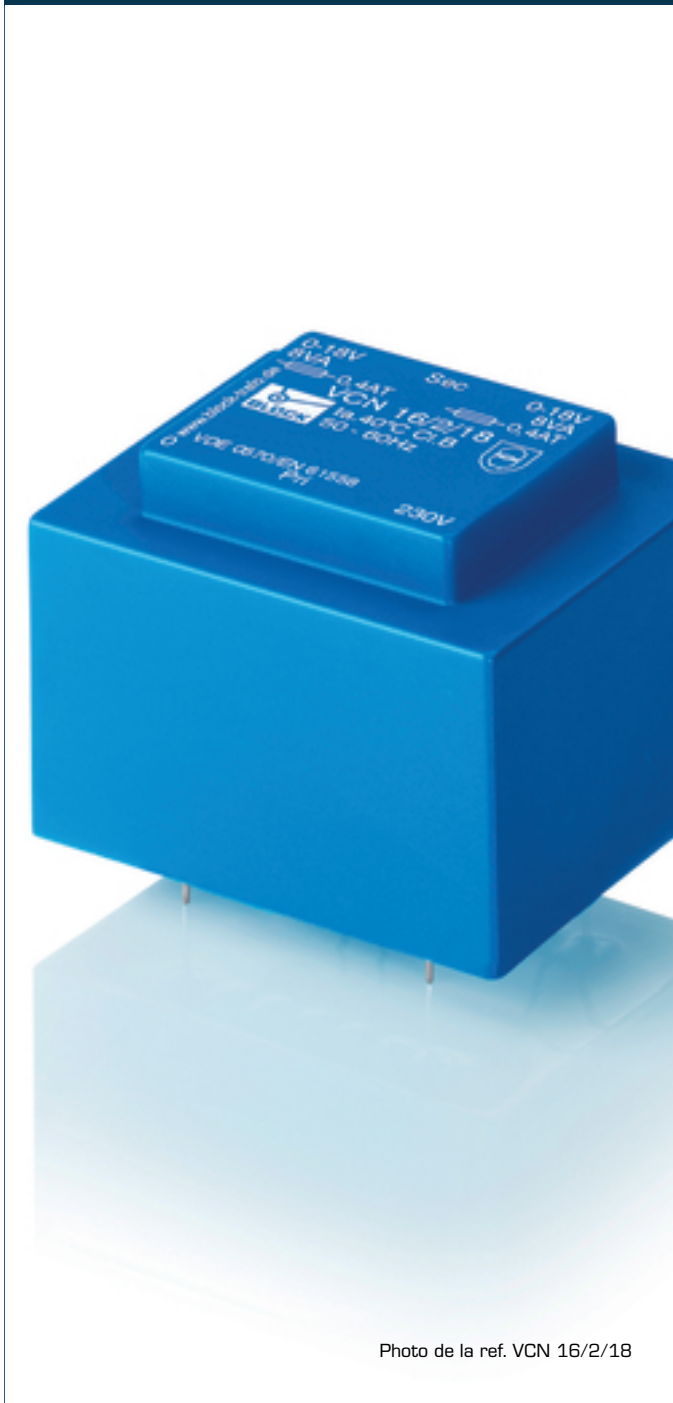
Photo de la ref. VCN 16/2/18