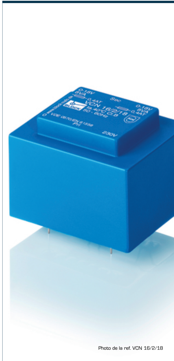
Photo de la ref. VCN 16/2/18