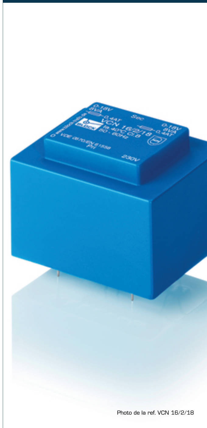
Photo de la ref. VCN 16/2/18