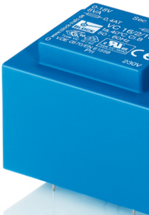
Photo de la ref. VC 16/2/18