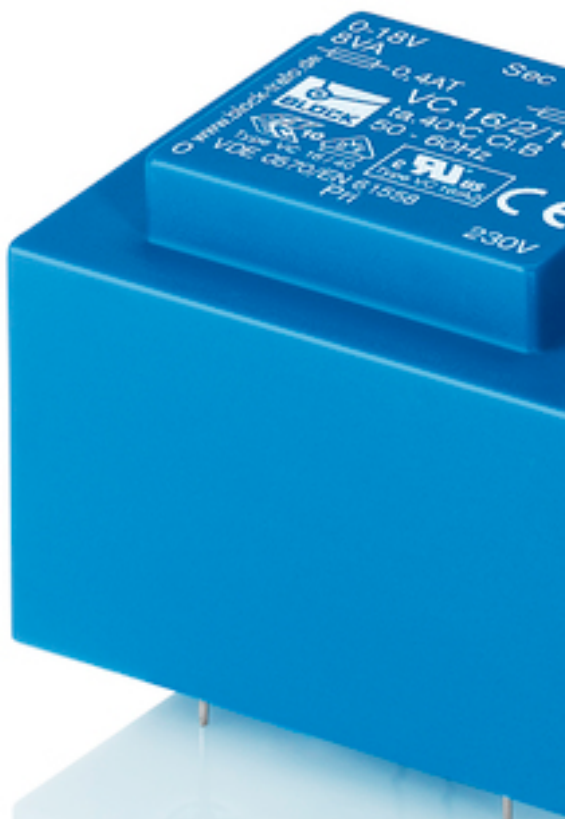
Photo de la ref. VC 16/2/18