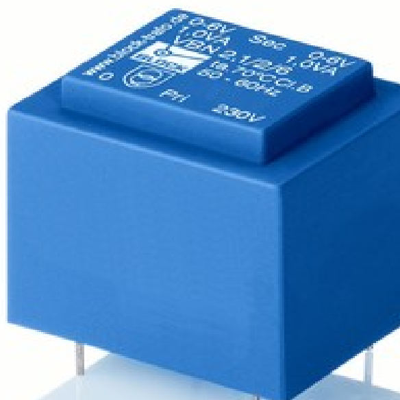
Photo de la ref. VBN 2,1/2/6