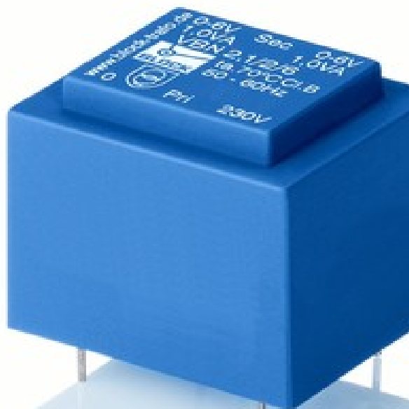
Photo de la ref. VBN 2,1/2/6