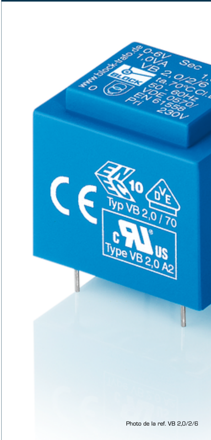
Photo de la ref. VB 2,0/2/6