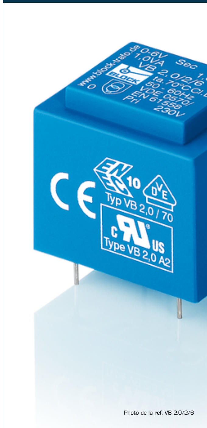
Photo de la ref. VB 2,0/2/6