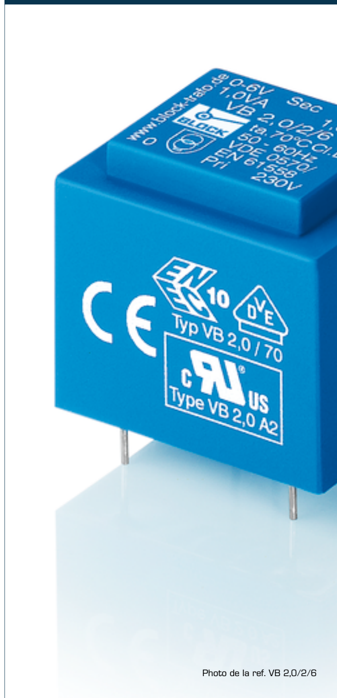
Photo de la ref. VB 2,0/2/6