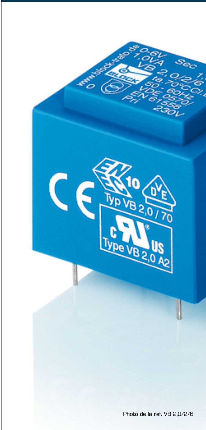
Photo de la ref. VB 2,0/2/6